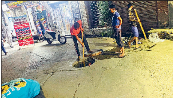
कुरुक्षेत्र। बाजार में रात्रि को सफाई करते कर्मचारी।

शहरी स्थानीय निकाय राज्यमंत्री सुभाष सुधा ने गत देर शाम छोटा बाजार के नजदीक नाले की सफाई व्यवस्था का औचक निरीक्षण किया। निरीक्षण के दौरान उन्होंने मौके पर ही नगर परिषद के सफाई कर्मचारियों को मौके पर बुलाकर रोटरी क्लब चौक से मेन बाजार स्थित सीकरी चौक तक नाले की सफाई करने के निर्देश दिए। नाले की सफाई व्यवस्था के तहत सफाई कर्मचारियों ने रातों ही रात नाले की सफाई व्यवस्था के कार्य को दुरुस्त किया। निकाय मंत्री ने स्पष्ट किया कि यदि कहीं पर भी सफाई व्यवस्था के कार्य में کوتाही